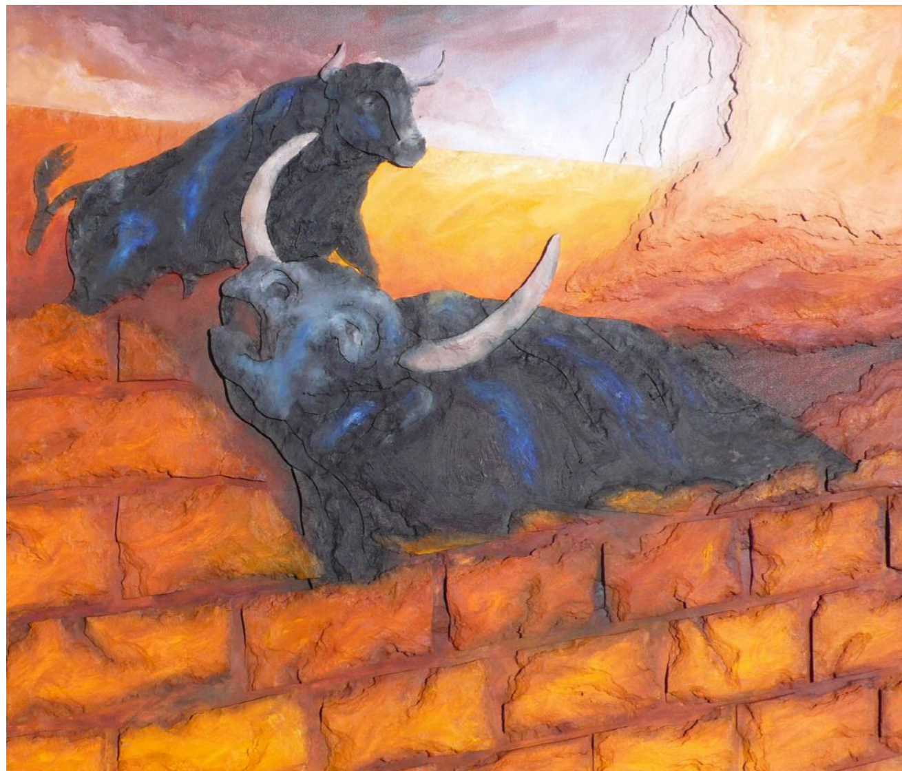
IL TORO SELVAGGIO HA ABBANDONATO LA STALLA (LUr 2)